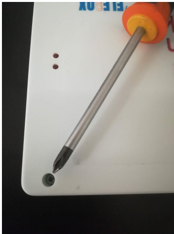
φ.1 Αφαίρεση καλύμματος